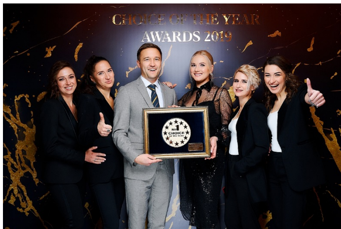
Фотоотчет Выбор года 2019